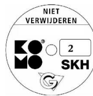
geschikt voor weerstandsklasse 2